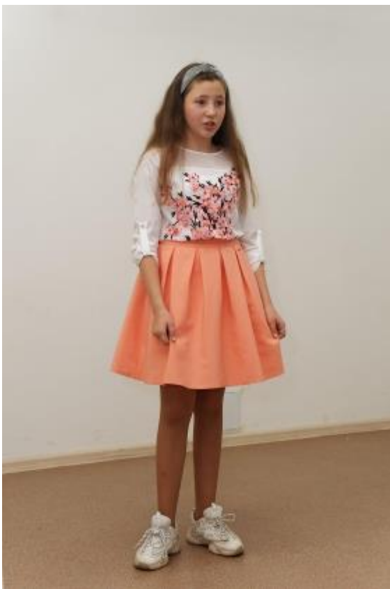
Праздничное мероприятие, посвященное Международному дню пожилых людей.