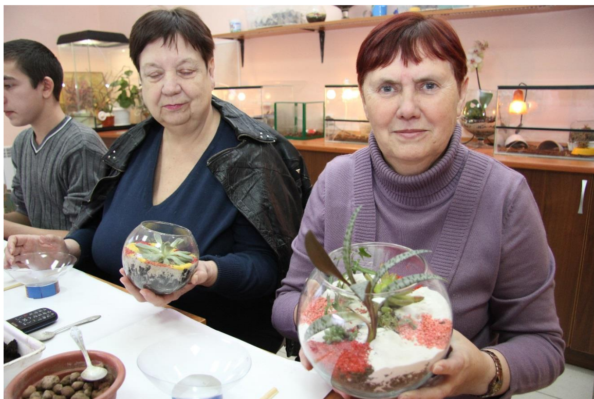
Мастер – класс по изготовлению флорариумов