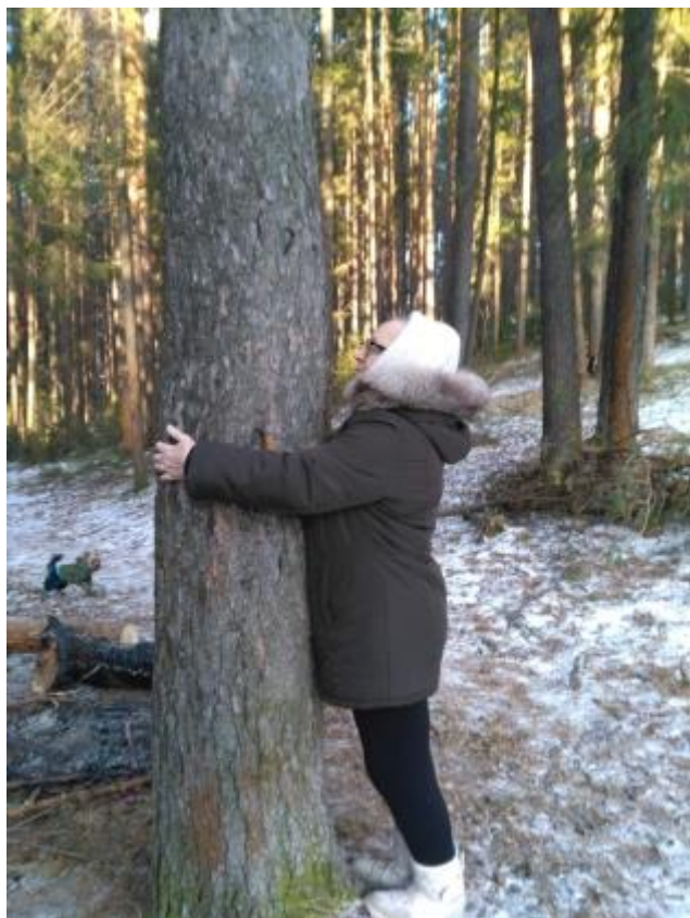
Октябрьская прогулка с людьми пожилого возраста в лесопарковую зону окрестностях города