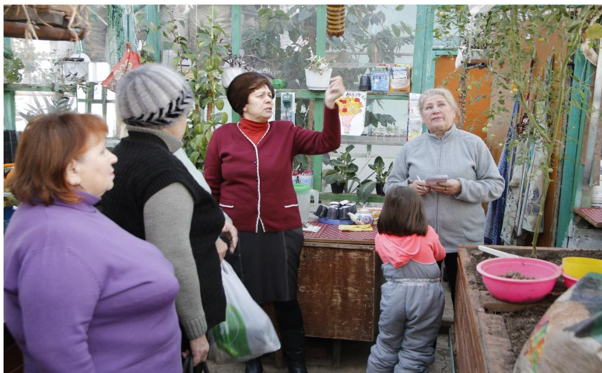
Мастер – класс «Огород на окошке»