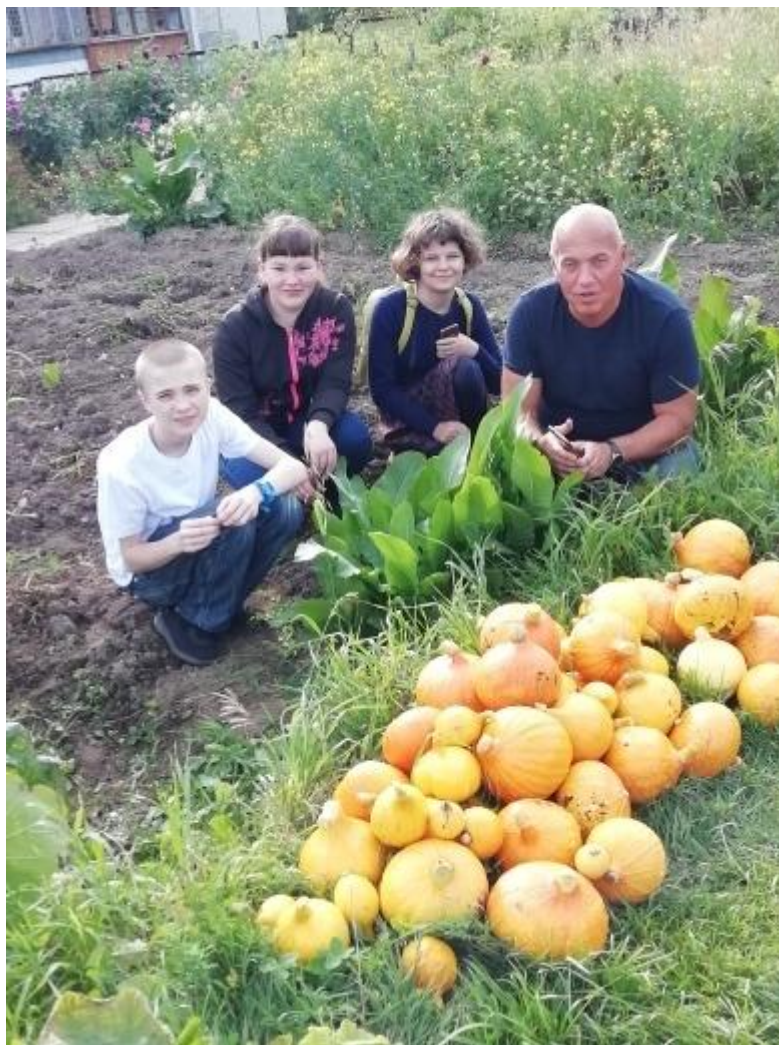
Сбор урожая на учебном – опытном участке Станции юных натуралистов для людей пожилого возраста.