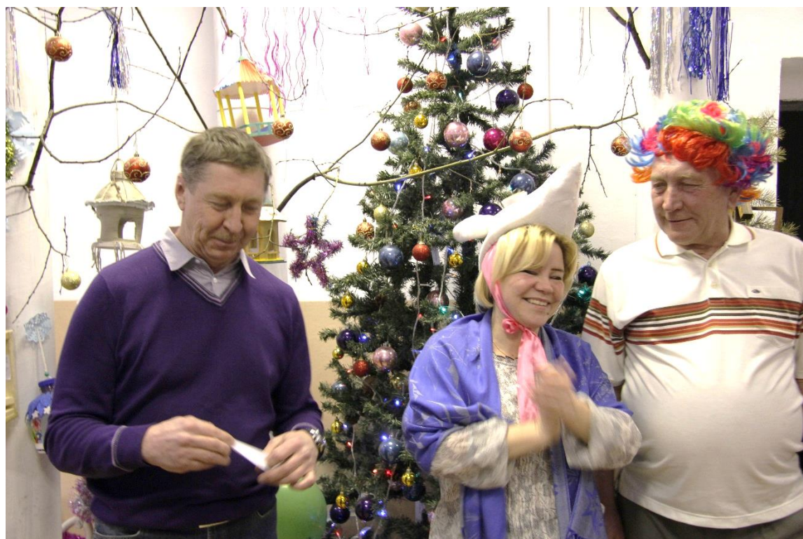
Праздник «Новогоднее чудо в подарок от юннатов»