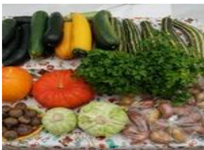
Благотворительная ярмарка для лиц пожилого возраста «Овощи от юннатов»