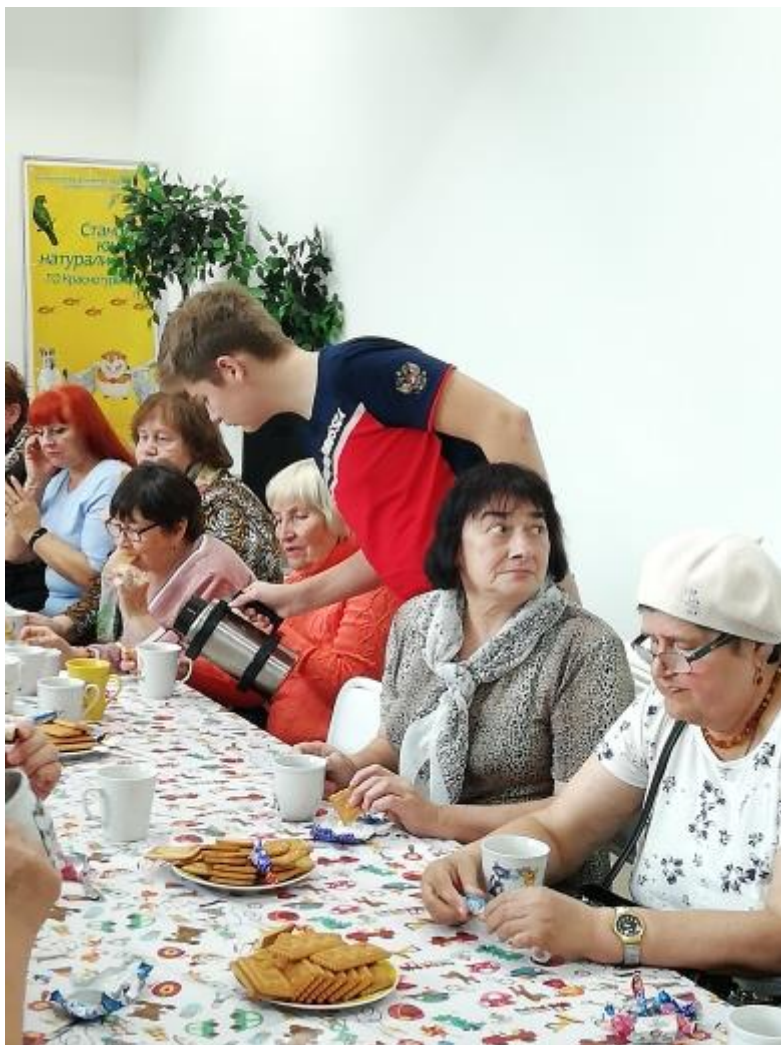
Беседа с чаепитием из трав, выращенных на учебном – опытном участке Станции юных натуралистов «Юннатская аптека здоровья»