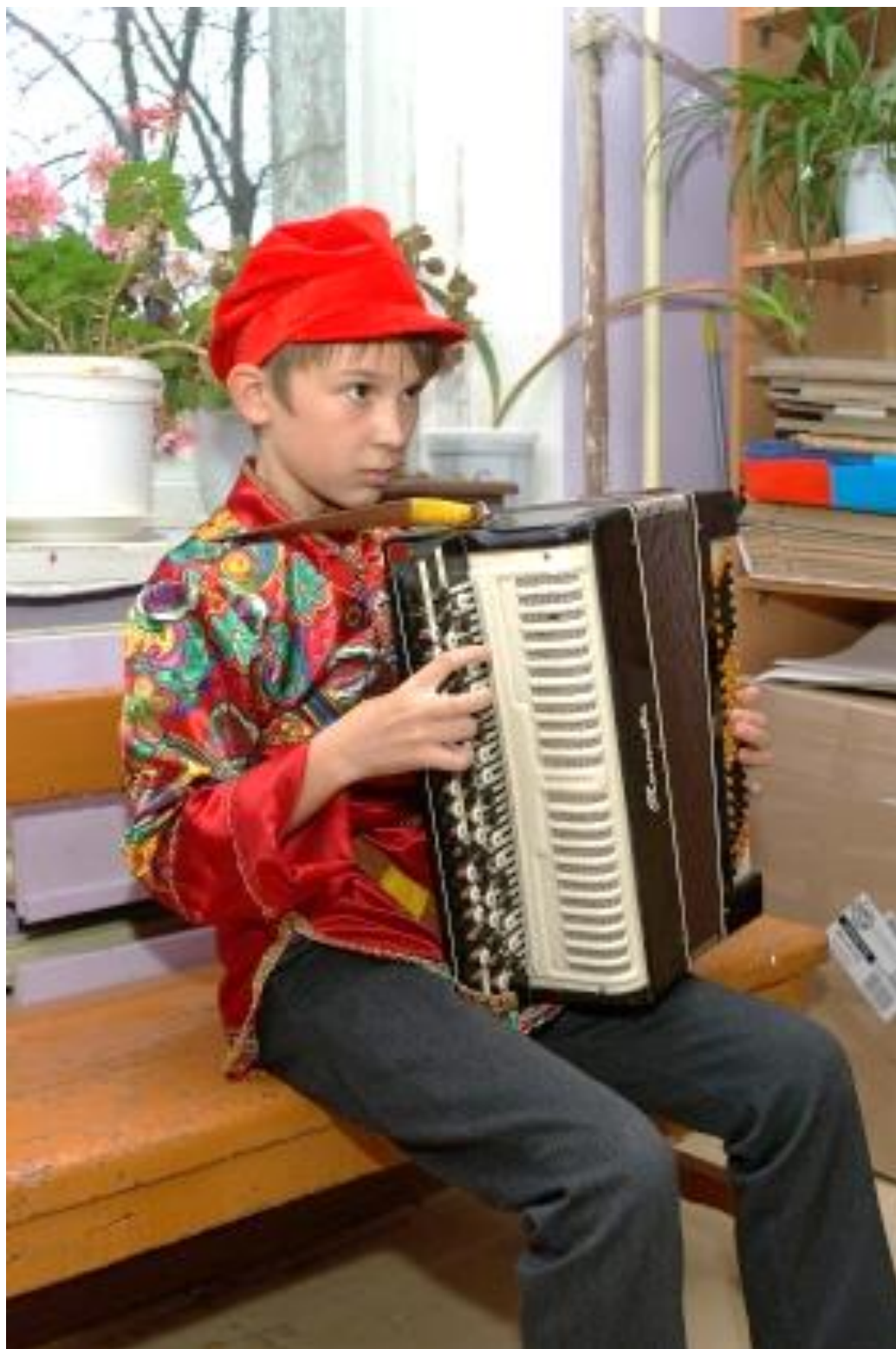
Фольклорно – игровая посиделка с чаепитием «Празднование масленицы с юннатами!»