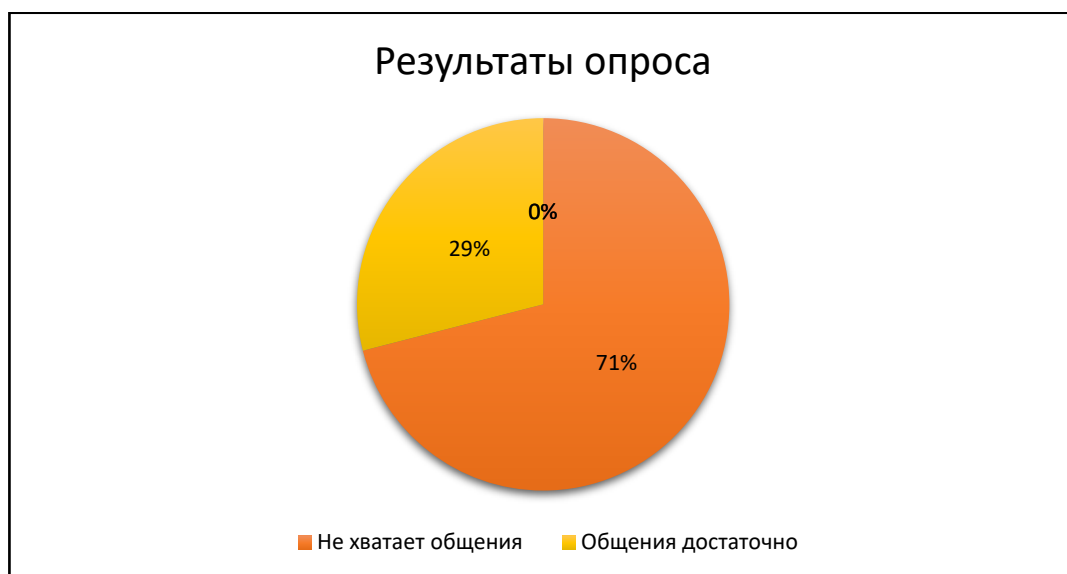
Рис. 1. Показатели опроса, проведенного волонтерами

При создании проекта «Станция юных натуралистов» волонтеры провели опрос, в котором приняли участие 200 респондентов, людей пенсионного возраста. Результаты вышли следующие: 71% опрошенных указали, что им не хватает общения после выхода на пенсию (рис. 1). Результаты опроса указывают на необходимость проведения проекта, так как большая часть опрошенных действительно нуждается в общении.