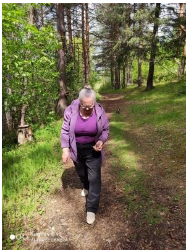
Сентябрьская прогулка с людьми пожилого возраста в лесопарк.