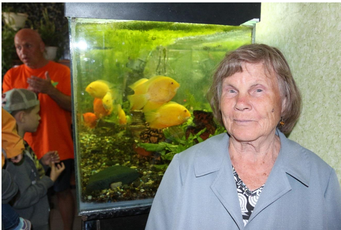
Анималотерапия. Влияние аквариума на здоровье глаз