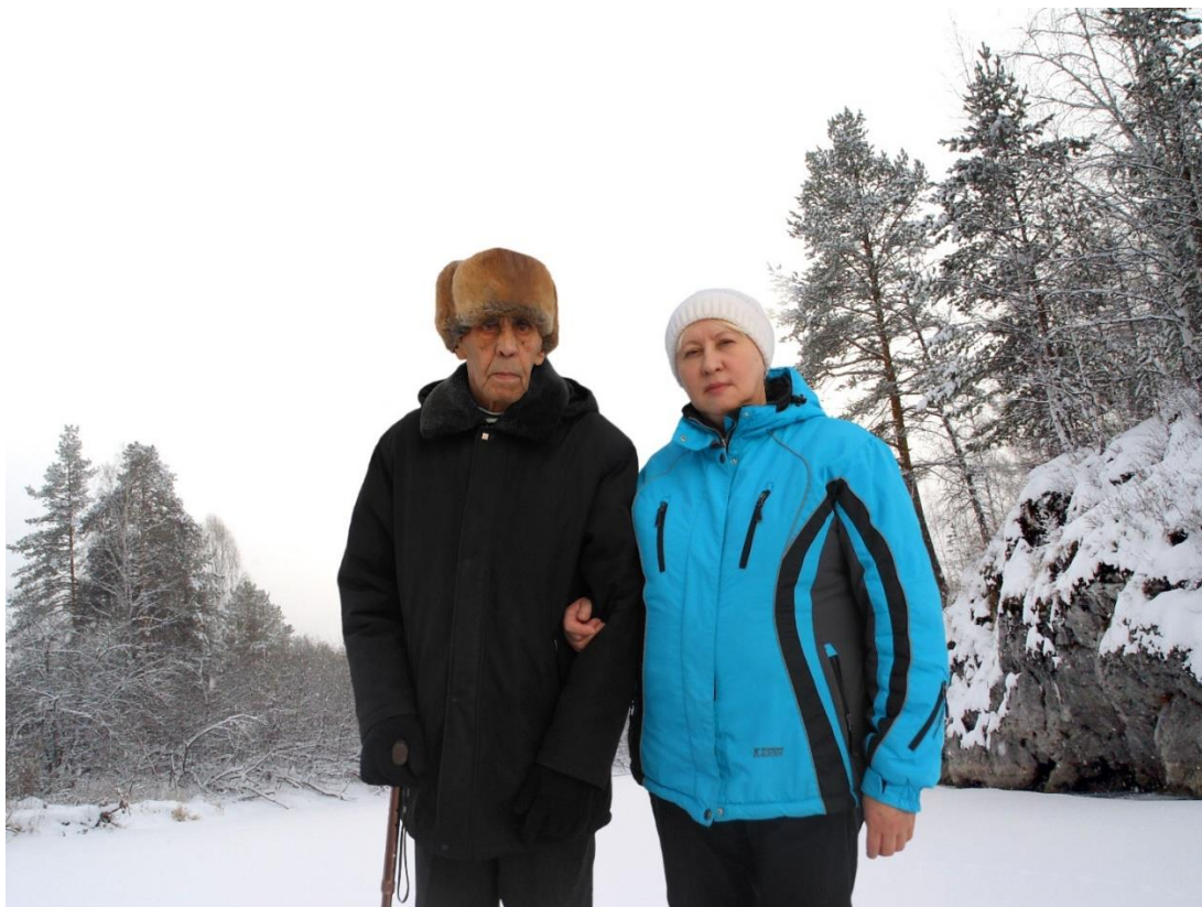
Февральская прогулка с людьми пожилого возраста в лесопарковую зону в окрестностях города