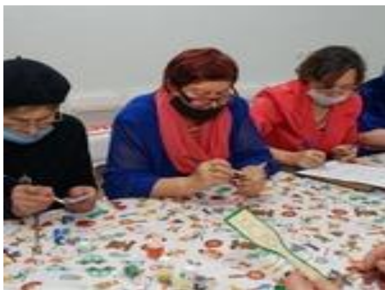
Мастер – класс по росписи изделий из дерева в русском – народном стиле